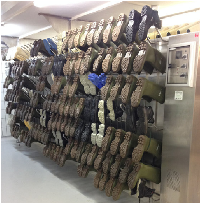
Installation spéciale pour 208 paires : Abbatoir Bell AG, Bâle