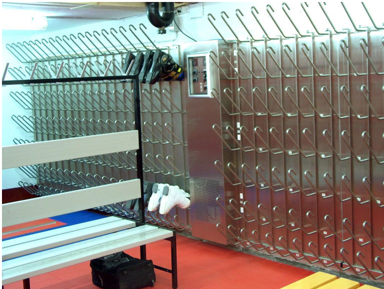
Installation spéciale pour 165 paires : Centralsport AG, Wengen