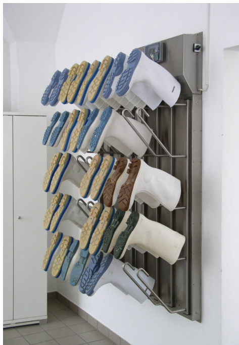
T1020 : Strähl Käse AG, Siegershausen