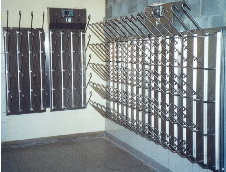
T1020 et T1040 : abbatoir à Saint-Gall