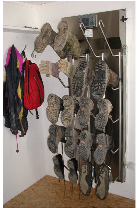
T1010 : Gartenbau Frick, Oberbüren