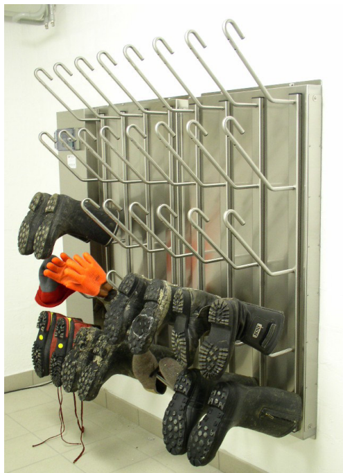
T1020 : dépôt communal, Heiden