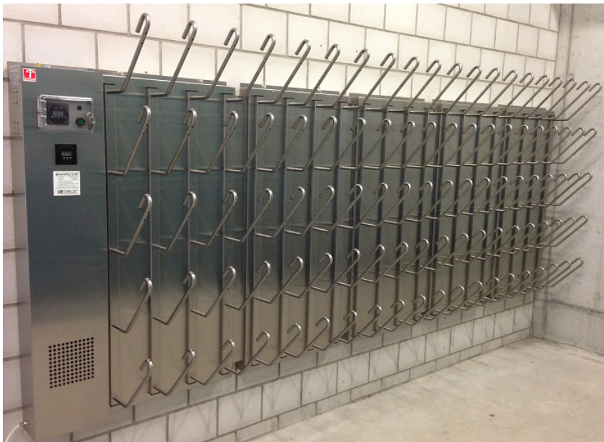
T1050 : BLS Netz AG, Frutigen