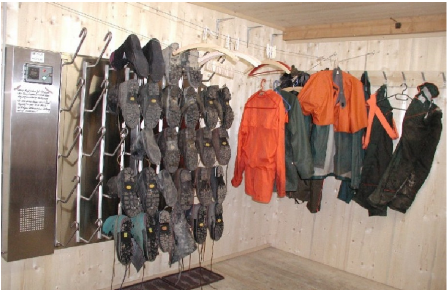
T1020 : administration forestière, Interlaken. En effet, les habits de travail sèchent en même temps !