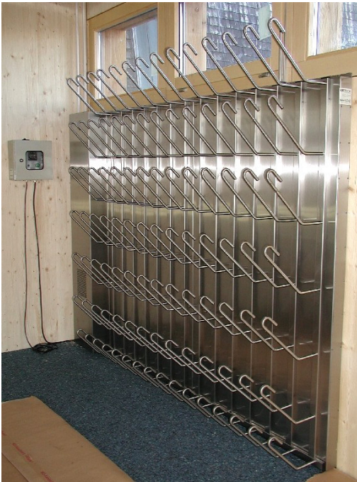
T1051 : Intersport Männlichen