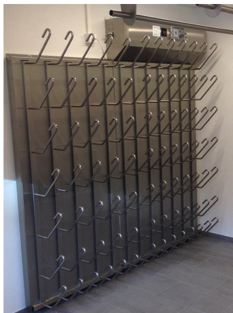
T1043 avec dispositif de suspension : Stöckl Gartenbau, Rossrüti