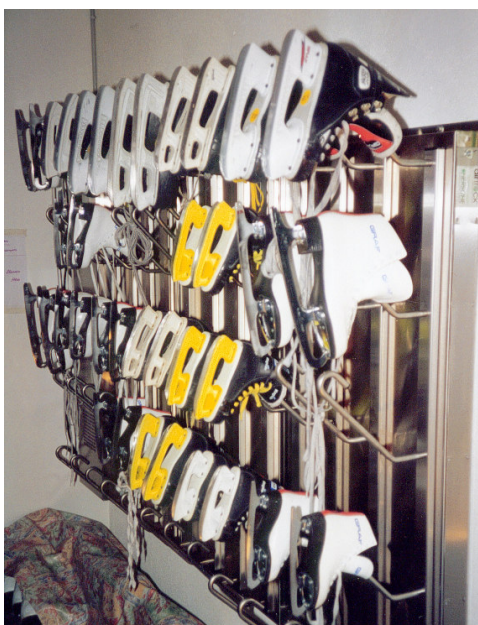
T1030 : patinoire, Frauenfeld